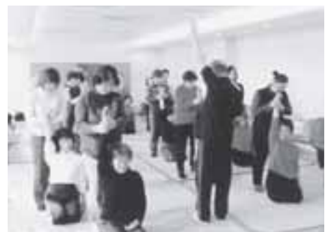
ストレッチの様子

1月22日から3月26日までの毎週木曜日に計10回のプログラムが行われ、約50名の方が参加し、一日に必要なカロリー量や高血圧を予防する食事のとり方など役に立つ知識の講義を受けたり、専門インストラクターとともに温水プールで、遊びの要