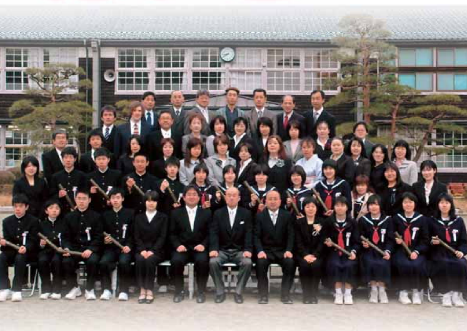
旅立ち たくさんの思い出を胸に（黒沢中学校卒業式）