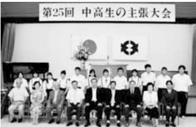
第25回 中高生の主張大会

会場では、各学校の生徒や保護者の方などが、主張を行う生徒の言葉に耳を傾けていました。