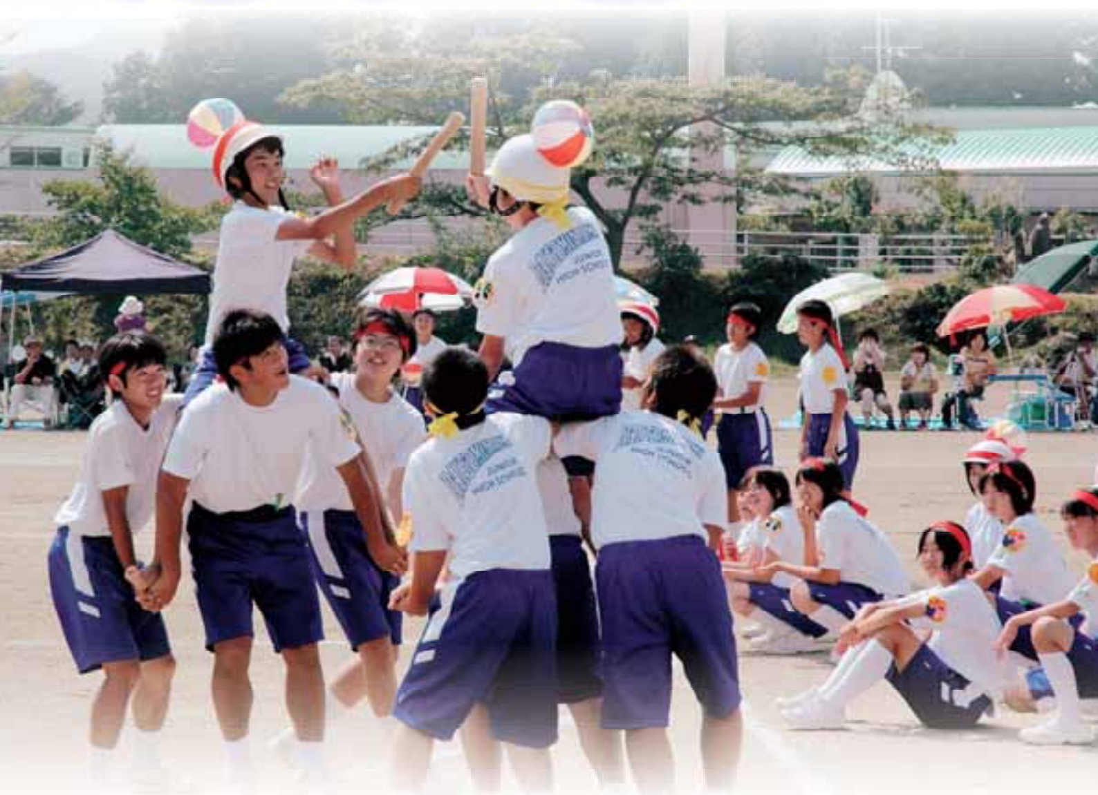
花より騎馬戦 (南中学校 翔南祭)