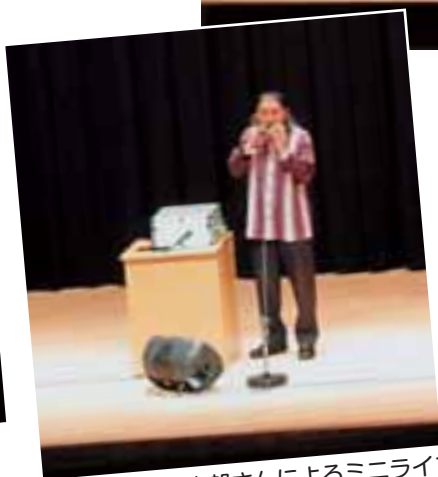
オカリナ奏者 宗次郎さんによるミニライブ