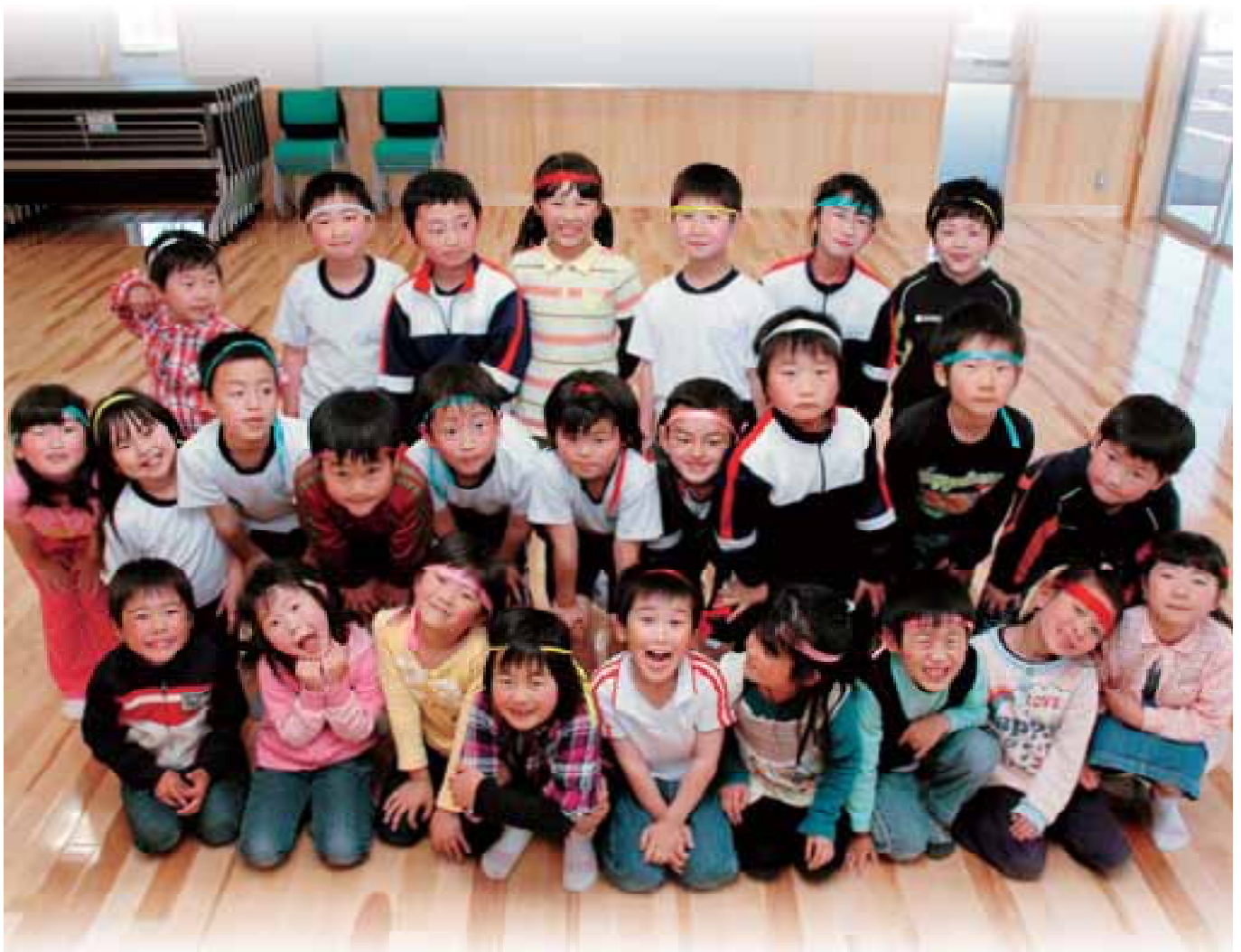
元気いっぱい活动中！だいで放課後児童クラブ