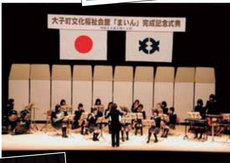
記念演奏会（大子清流高校吹奏楽部）