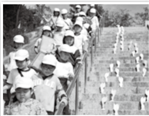
県北芸術祭の作品鑑賞