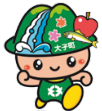
袋田の滝キャラクター たき丸

〒319-3526 茨城県久慈郡大子町大字大子866番地 Tel/0295-72-1111(代)/0295-72-1114(直通) Fax/0295-72-1167 E-mail/soumu@town.daigo.lg.jp http://www.town.daigo.ibaraki.jp/