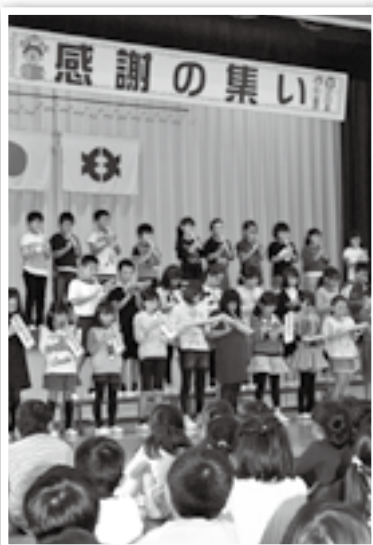
感謝の集いの様子

10月19日には、日頃お世話になっている地域の方々を招待して感謝の気持ちを伝えようというイベントの「感謝の集い」を行いました。学年ごとに合唱や合奏を披露し、とても楽しいひとときを過ごしました。児童のみんなは、地域で行われている行事にも積極的に参加しています。この秋には6年生が「町音楽会」に参加したり、金管クラブが「大子町芸術祭音楽祭」や「奥久慈大子まつり」で演奏したりしました。10月には大子駅前商店街で行われていた茨城県北芸術祭の作品鑑賞会も全校児童で行いました。見慣れた街並みが今まで以上に魅力的に映りました。だいで小学校では、ふるさと大子を知って、未来にはばたく児童を育てるための地域学習「大子学」を行って、もっともっと大子のことを知る学習にも取り組んでいます。このようにだいで小学校は地域の皆さんと共に歩んでいる学校です。学校の様子はポータルサイト ( http://www.daigo.ed.jp/daigo-syo/ ) で毎日発信しています。ぜひ、チェックしてみてくださいね！