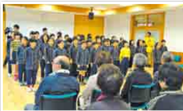
お別れセレモニー