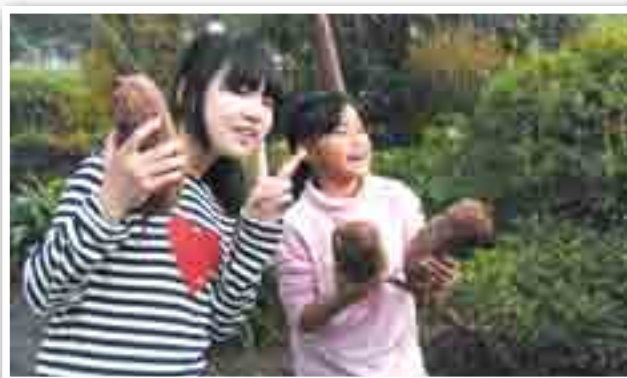
大きなサツマイモにびっくり!