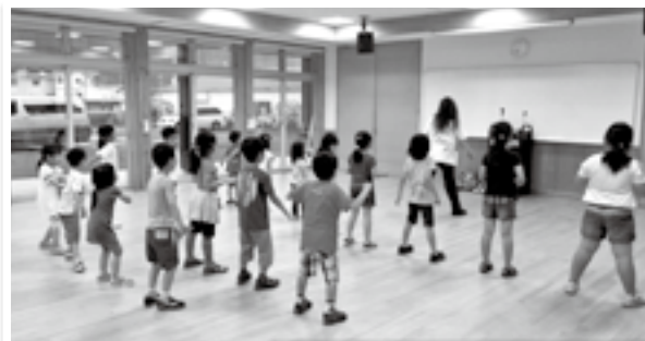
▲キッズダンス教室