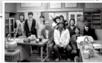
▲旧上岡小跡地保存の会の皆さんと