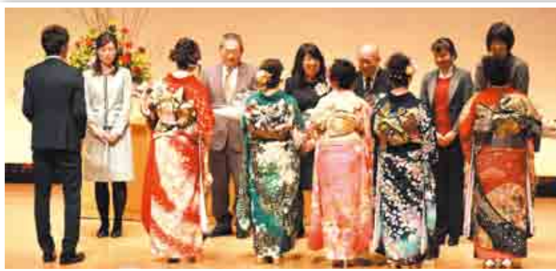
恩師への花束贈呈