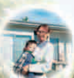
子育て支援住宅の風景