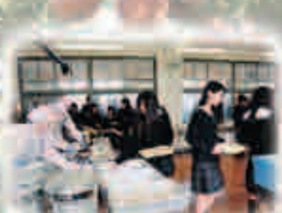
県立大子清流高校で給食をとる生徒たち