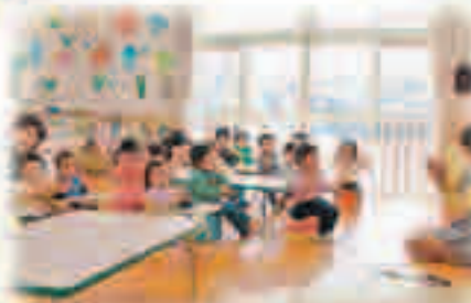
保育所(園)保育料・幼稚園授業料が無料