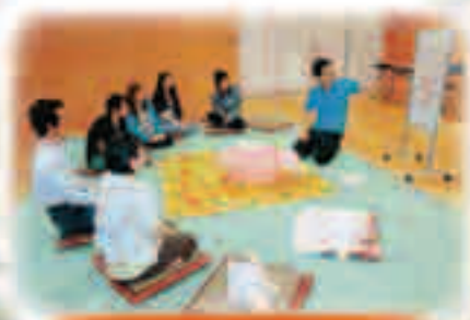
パパママ教室の開催風景