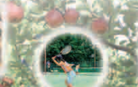
中学校部活動費を助成