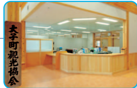
大子町観光協会事務局(観光案内所)