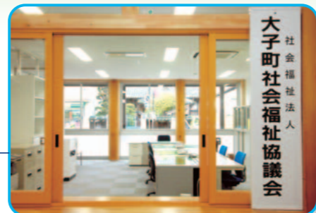
大子町社会福祉協議会事務局