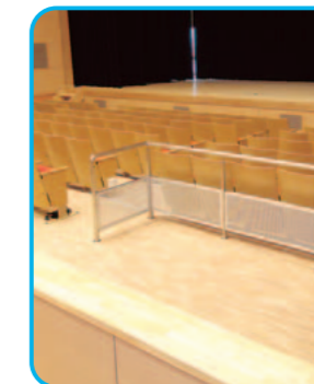
車イス専用コーナー