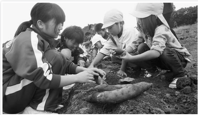
サツマイモの収穫の様子