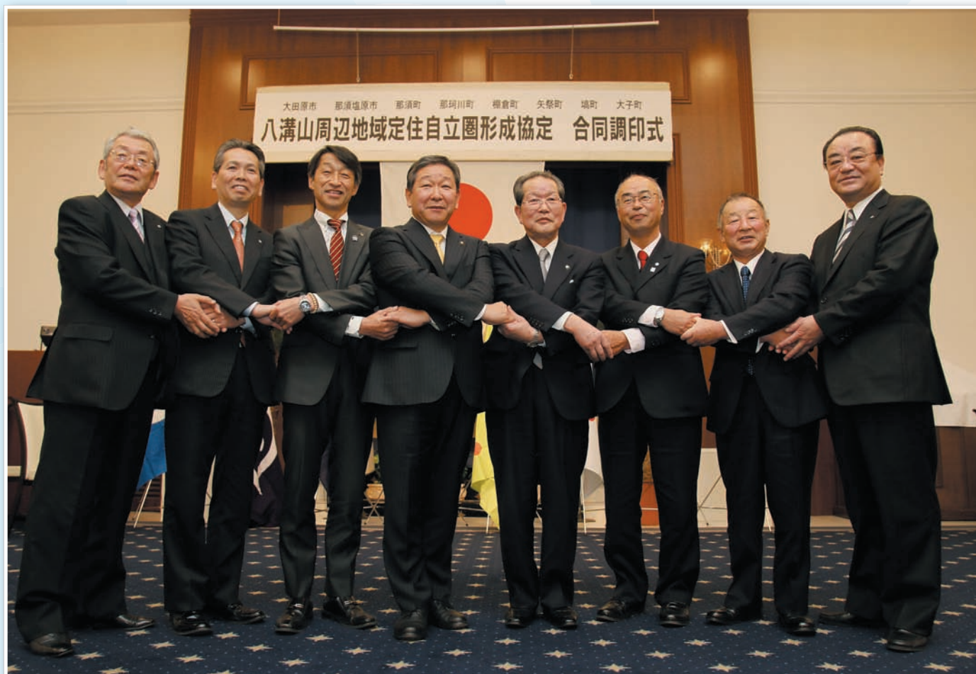
八溝山を囲む2市6町が、定住自立圏形成協定を締結（栃木県大田原市）