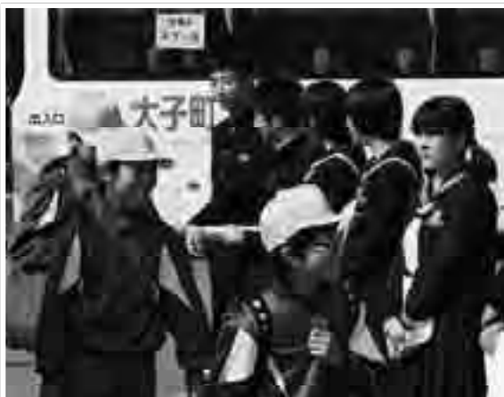
生瀬小学校でのあいさつ運動

その後、視聴覚室をお借りして、小学1・2年生へ紙芝居の読み聞かせを行いました。物語を読む中学生と、その話を聞く小学生。どちらも、充実した時間を共有することができました。2学期のあいさつ運動は、縦割り班活動として生瀬小学校を訪問する予定です。