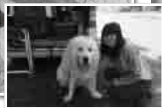
OSJ奥久慈トレイルレースにスタッフとして参加しました♡