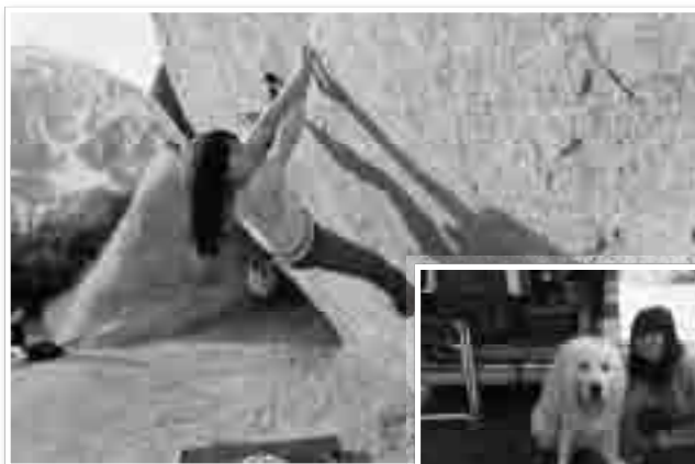
道具を使わず、岩壁を登る。写真は、アメリカ・カリフォルニア州ビショッブの岩場