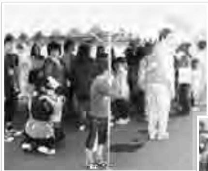
避難所開設・炊き出し訓練

会場では、自主防災組織による活動訓練や、防災ヘリによる救助訓練、JR緊急停止列車乗客救出訓練等地震による大規模災害が発生したことを想定した訓練が行われ、緊急告知FMラジオを活用し災害が発生したことを告知する動作確認も併せて実施されました。