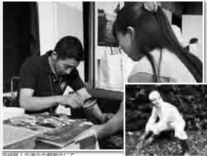
茨城県人会連合会懇親会にて

今後半年の目標は、上野宮のベテランワサビ職人の方々の指示の下、整地したワサビ田に苗を植え、かつての美しい姿に戻したいと考えております。手相占いも引き続きよろしくお願いたします。