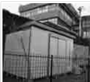
泉町（大子町役場敷地内）に設置された防災倉庫