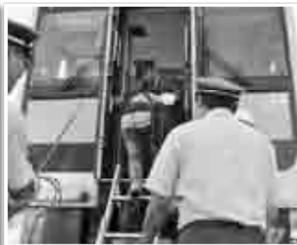
緊急停止列車乗客救出