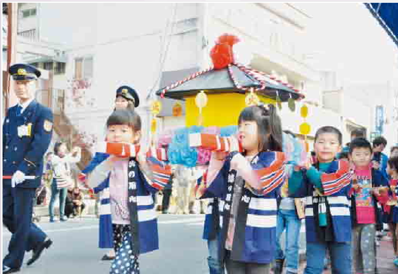
もういいかい 火を消すまでは まあだだよ (大子幼稚園防火パレード)