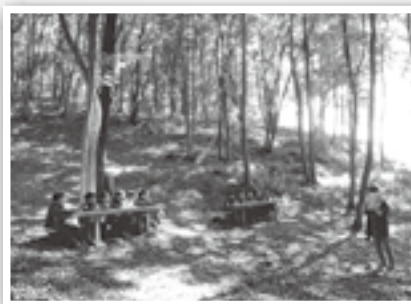
裏山「ふれあいの森林（もり）」での読み聞かせ