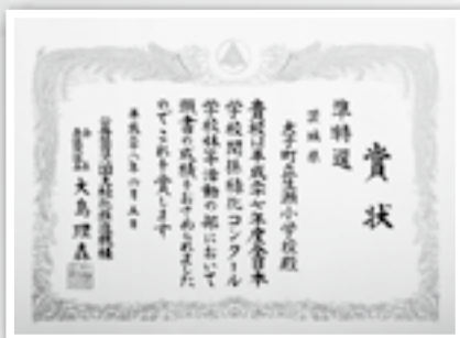
6月5日開催「全国植樹祭」の中で表彰式が行われました

生瀬小学校では、裏山を「ふれあいの森林（もり）」と命名し、環境整備を図るとともに、自然環境を生かした教育活動を展開しています。今後も学校林活動を推進し、心豊かなたくましい児童の育成を図っていききたいと話していました。