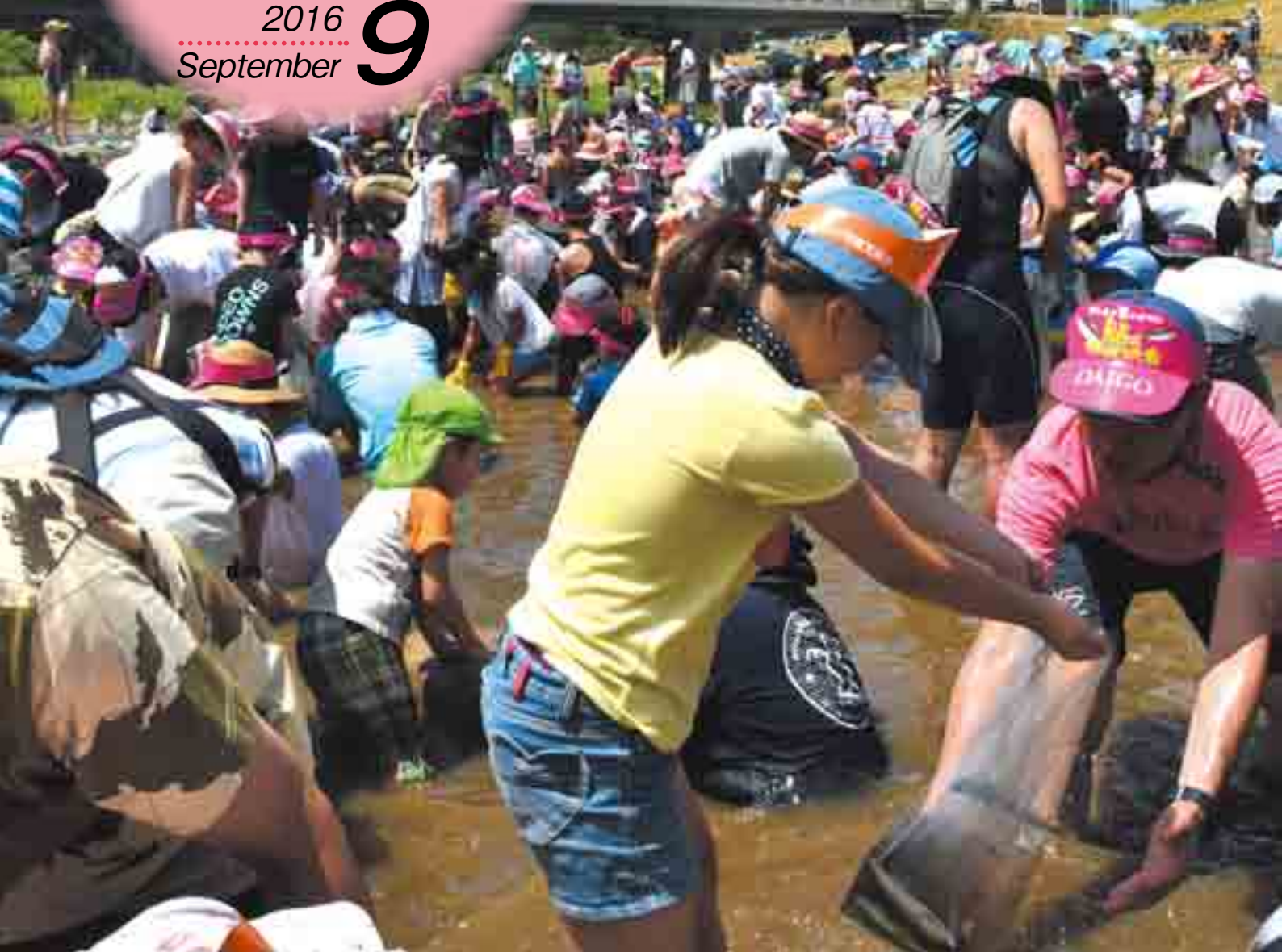
鮎のつかみどり大会