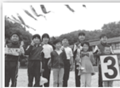
毎年4～5月に山を利用して張られる鯉のぼりも自慢のひとつです