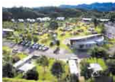
大子広域公園オートキャンプ場 グリーンヴィラ

そんなスタッフおすすめの利用方法は、「テーマを決めてゆっくりじっくり楽しむこと」。料理や観光、道具など、あれこれ手を出さずに的を絞って利用することも一つの方法だそうです。