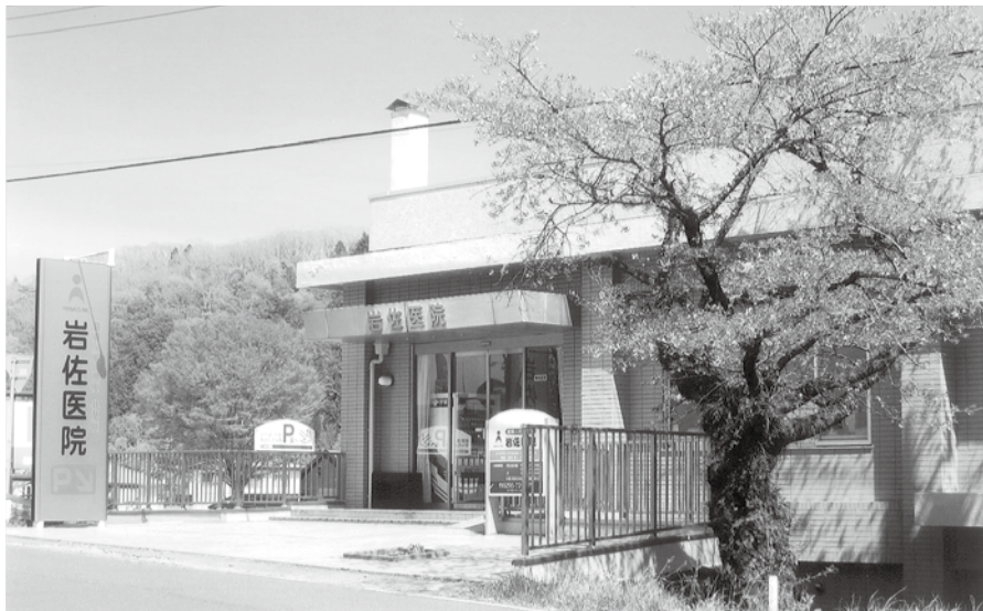
産後ケアの舞台となる医療機関

【健康増進課長】産後に心身の不調、育児不安がある者が体調の回復、不安の解消を目的とし、安心して子育てができるように支援する事業として実施していく。対象者としては、家族などから十分な家事や育児の支援が受けられない、町