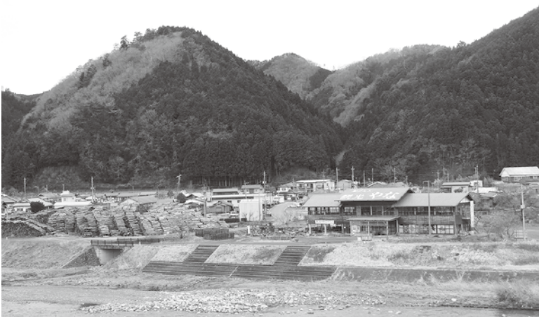
経営改善と木材撤去が望まれる観光やな

【町長】 町の大きな観光拠点の1つである観光やなの救済し、存続するというのが私の判断である。その緊急的な対応として、土地の