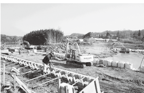
護岸工事が進められる久慈川（矢田地区）

るが、親水公園の設置など何らかの活用を考えて国や県に要望しているのか。 【建設課長】 現在工事中であり、護岸の全体像が出来上がる前の段階で正式な要望はしていないが、整備後について何らかの利用が出来ないかということは申し入れている。