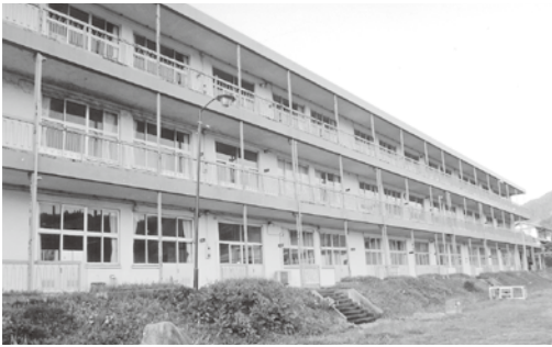
保管施設として整備される旧下野宮小学校

【中郡】本町には、町民の皆様から寄贈いただいた多数の農具や遺跡から発掘された土器・考古遺物や化石・鉱物など、貴重な文化財が数多く収集されている。これらの文化財展示施設として旧下野宮小学校の校舎内に整備する方針となったが、展示の内容について伺いたい。 【町長】利用できる保管施設にする。あくまでも保管が目的だが、保管施設を活用して調査研究を行いたい