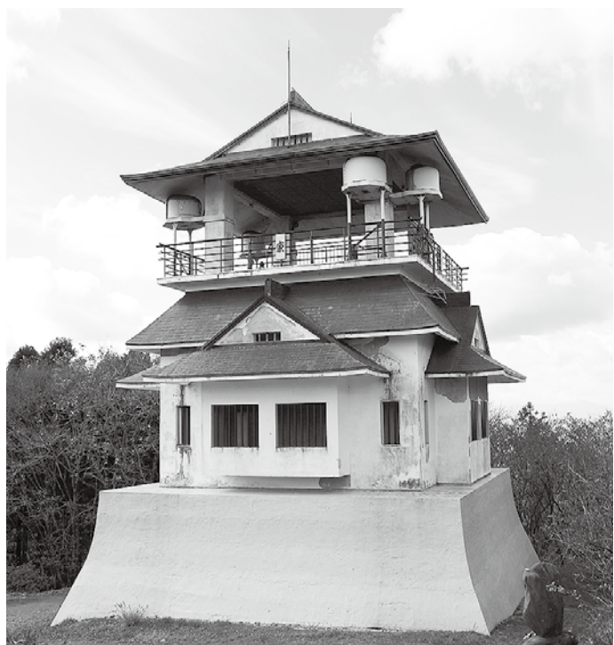
すばらしい眺望の八溝山展望台