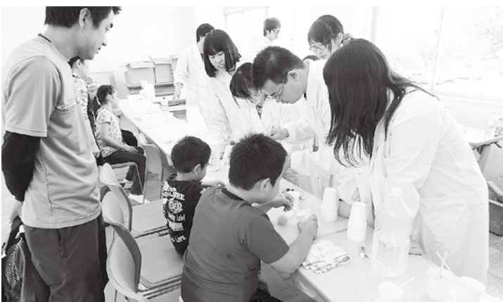
リダイゴ～科学実験教室とともにスポーツの交流事業も

【総務課長】 優先順位を決めて執行して行くのでやむを得ない。人材育成・教育が必要である。管理職となる立場の方は、職場経験を積むために、定期的に異動をしてスキルアップを図る方針である。