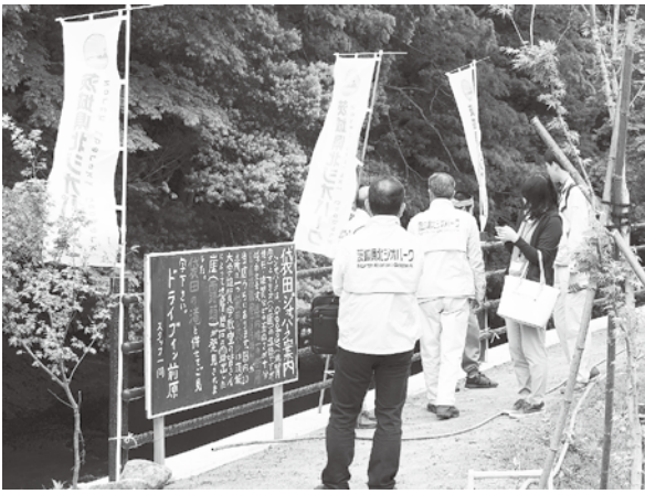
県北ジオパークの説明を行う事務局とインタープリター