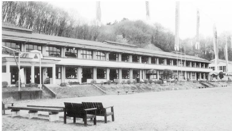
地元にとって大切な学校

【町長】 大子町の小中学校の適正配置については、児童、生徒とその保護者、学校関係者だけの問題ではなく、地域を超えて町全体の問題であると認識している。今