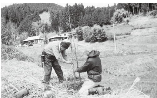
町から配布されたハナモモの苗木の植樹

【町長】 総合計画の中で庁舎建設基金を設置するとなつている。1年で結果を導き出したと言う話だが、私の感覚では1年もかけたのかという感じがする。人口が2万人と1万人の町では業務はそんなに変わらない。規模、機能から結論を