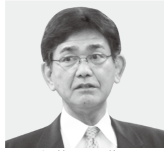
須藤 明 議員

病の予防や寝たきり防止などに効果的である。日体大の専門家による関係者に対する指導者講習会を行い、適正な健康づくりにつなげることは大切である。日体大と連携を図り検討して参りたい。