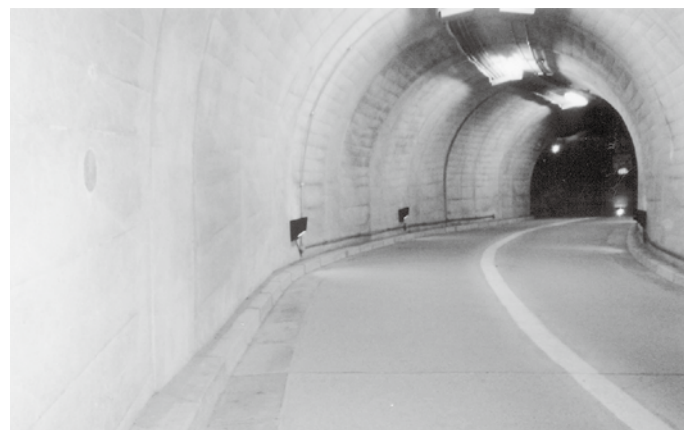
手すりの設置が待たれる観瀑トンネル

【中郡】高齢化社会の時代に入り、観光客も高齢者が多くなっている。今後ますます進む人口減少や高齢化により観光客の人数も減少することが予想される。そういった中、観瀑トンネルの側面に「手すりを設置してほしい」との声が高齢者の皆さんから多く聞く。トンネル内は全体的に坂道で、床が濡れている時など滑りやすく、また高齢者には坂道続きで大変である。手すりを設置すれば安心して通行できると思うが、設置について町の考えを伺いたい。