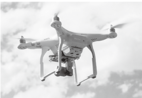
空撮動画が拡散すれば観光広報になる

【観光商工課長】空撮動画コンテンツの実施を想定すると、空撮の規制対応なども考慮しなければならぬ。費用対効果も含め総合的に検討する。