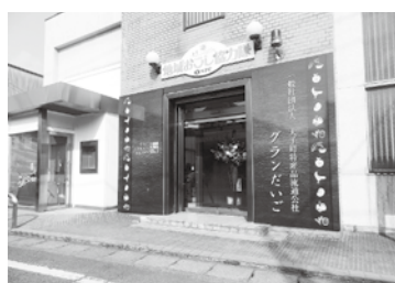
この場所でもいいのか特産品流通公社

品流通公社とガバメントクラウドファンディングの活用には、特産品を並べるか公社そのものを移転するかなど、制度設計を検討しなければならぬが、おもしろい提案なので検討したい。