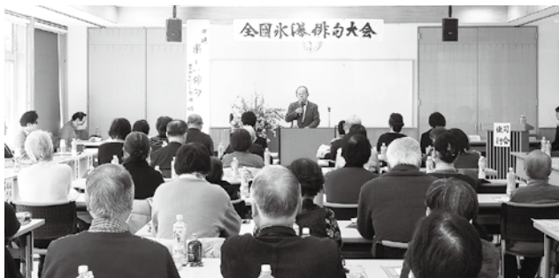
全国氷瀑俳句大会の様子

のが現状である。イベント情報を随時提供できる電光掲示板は効果的である。振興公社、観光協会と連携しながら検討して参りたい。