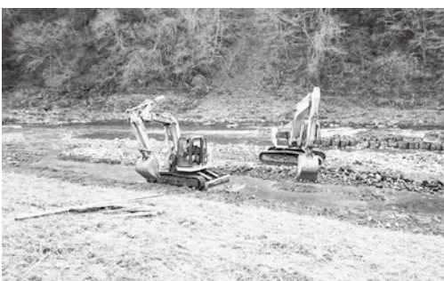
近づく茨城国体、カヌーのコース作り