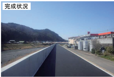
R1久慈川左岸北田気築堤護岸工事 (株式会社大藤組)