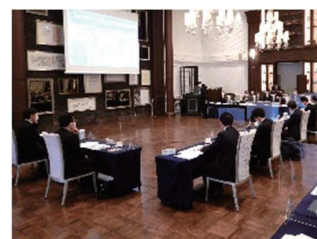
大子まちなかビジョン 推進協議会

大子町では、令和元年東日本台風での甚大な被害を受け、昨年10月から、庁舎移転に伴う防災力の強化や、交流人口の増加によるにぎわいづくり等を盛り込んだ、大子まちなかビジョンの検討を開始し、3月31日に策定、公表されました。ビジョンには、現在の役場庁舎跡地の利活用や「道の駅奥久慈だいていご」の防災・交流機能強化を中心とした今後の大子町の取り組みや、久慈川緊急治水対策プロジェクトが盛り込まれています。