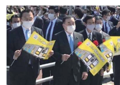
知事らによる歓迎