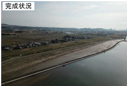
R1久慈川左岸竹瓦地先河道掘削外工事 (高橋建設工業株式会社)