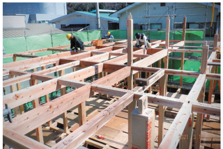
▲新築工事現場 木組建方