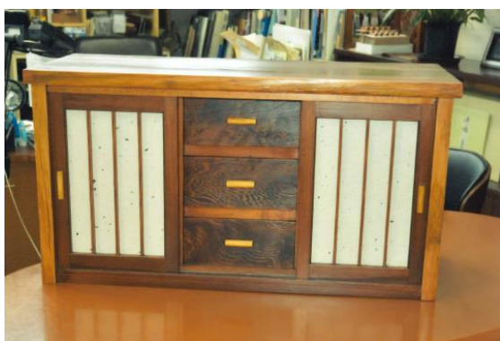
テレビ台 (スギ) 漆塗