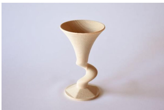
カップ試作（ヒノキ）