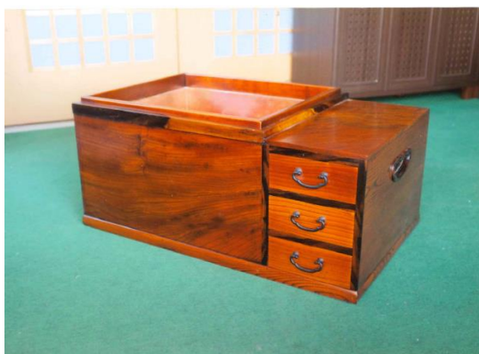
火鉢 (ケヤキ) 漆塗