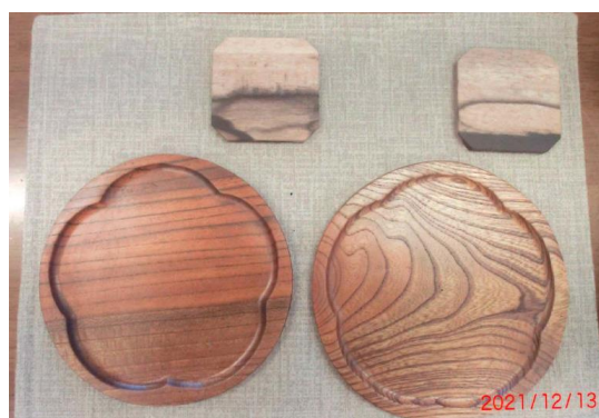
お盆・コースター (ケヤキ)