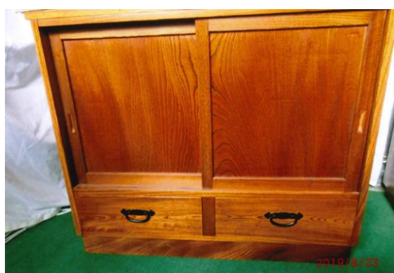
戸棚 (ケヤキ) 漆塗