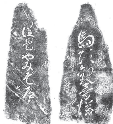
やみぞ道 (大字高柴地内)