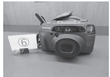
⑥PENTAX ESPIO 160