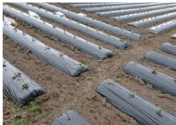
枕畝途中に設置した排水路