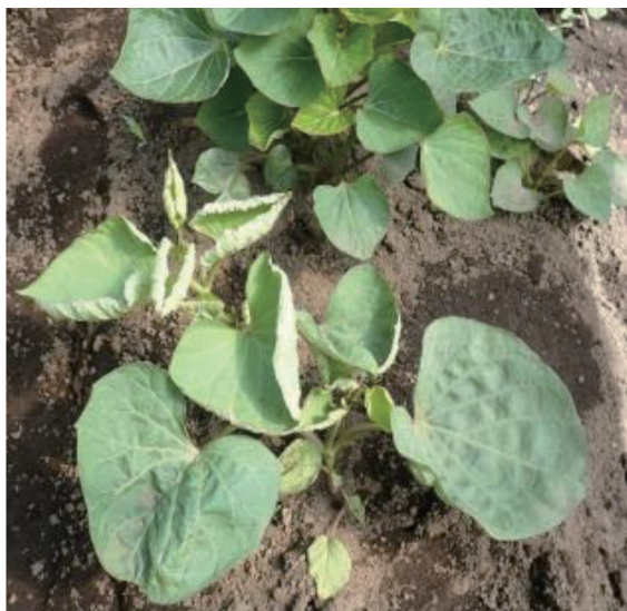
葉巻、株の萎縮症状