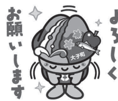
スタンプイメージ