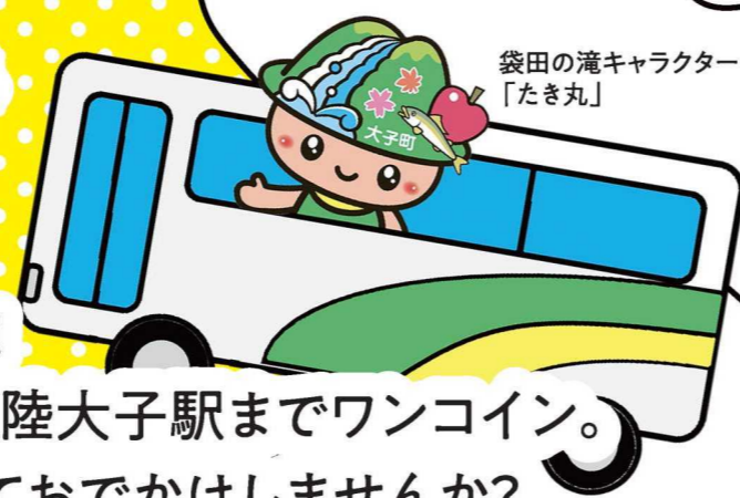
袋田の滝キャラクター「たき丸」

東京-大子間が片道約2時間40分! 新幹線停車駅的那須塩原駅から常陸大子駅までワンコイン。 奥久慈おでかけ快速バスを利用しておでかけしませんか?