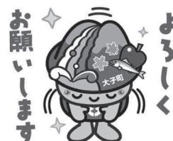
スタンプイメージ