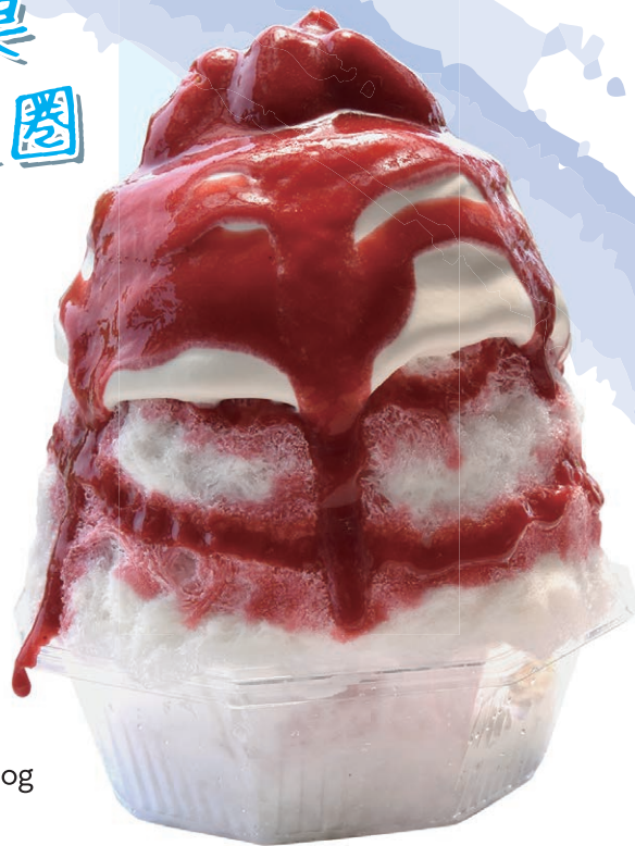
ベリーベリーショート