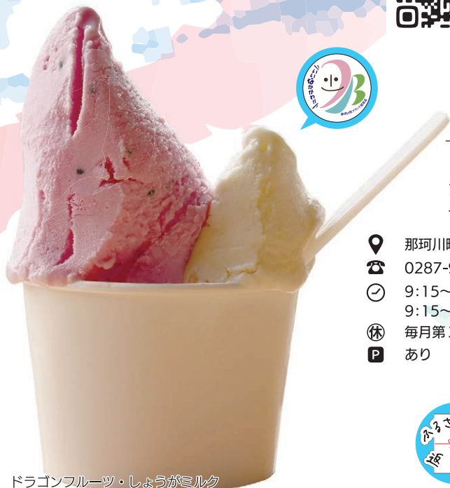
ドラゴンフルーツ・しょうがミルク