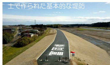
土で作られた基本的な堤防

地域のみなさまも近くに行ったら安全な場所から堤防をつくる様子を見学してみてください。