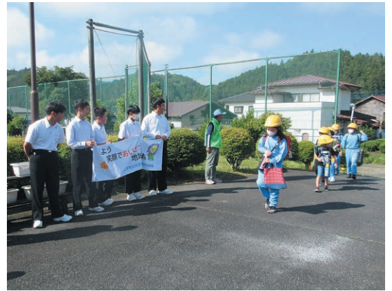
小中連携あいさつ運動