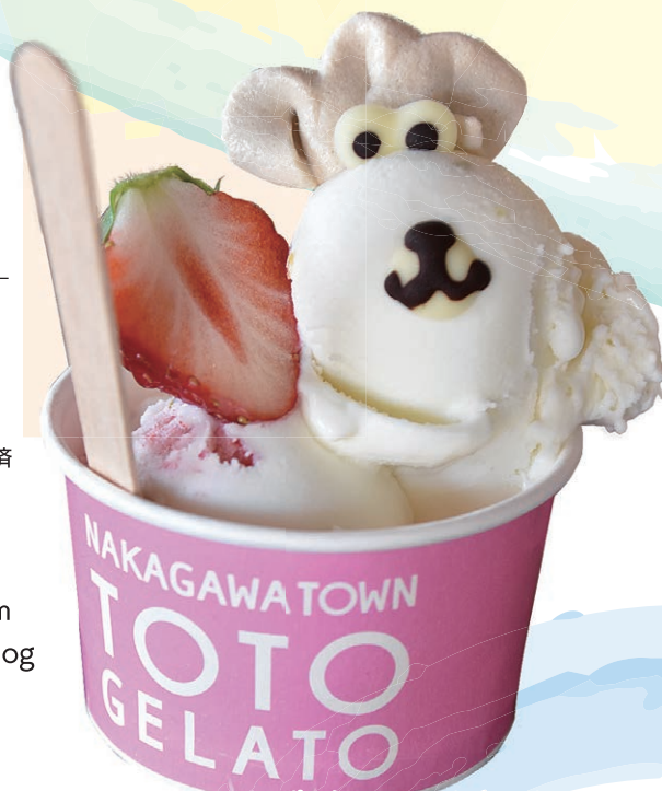
マスカルポーネレモン・いちごミルク

商品を購入したお客さんからの評価を取り入れ、一定の基準を満たした商品を「那珂川町ブランド」として認定。町内で生産・加工・販売される商品と町のイメージ向上を図っています。