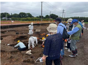
▲現地説明会の様子

高渡館跡の発掘調査では、平安時代の住居跡や室町時代の堀跡などを確認し、多くの遺物が出土しました。説明会には地域住民約30名が参加し、担当者の解説を興味深く聞いていました。