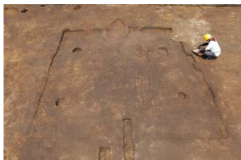
▲平安時代の住居跡