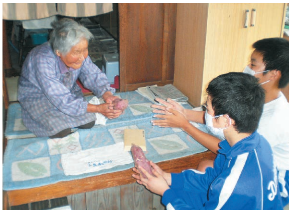
一人暮らし老人宅訪問

もう一つの特色ある教育活動として、地域や郷土を理解し、地域の発展に寄与してくれた人々への感謝の気持ちを育てることを目標として、一人暮らし老人宅訪問を実施しています。生徒は事前に自宅周辺に居住するお年寄りを調べ、自分たちで育て、収穫したサツマイモと手紙を贈ります。また、災害時に生徒が自宅周辺で行うボランティア等の際にも役立つ活動として位置付けています。