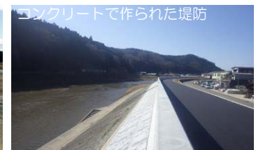
コンクリートで作られた堤防