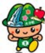
袋田の滝キャラクター『たき丸』