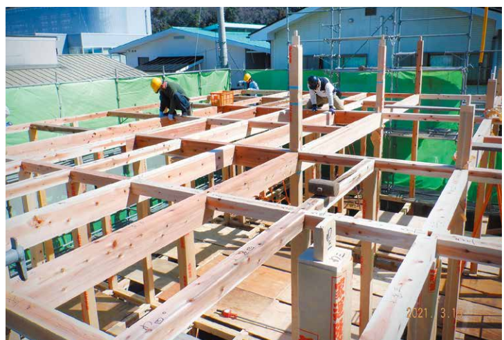
▲新築工事現場 木組建方