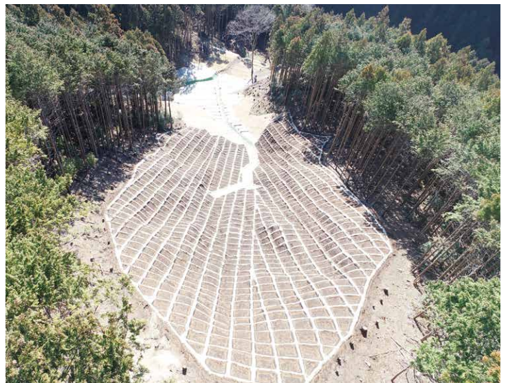
▲ドローンを使って撮影した完成工事写真です。新しい技術も取り入れています。

同じ内容の工事でも条件が良い場所、悪い場所様々です。工事に携わったからこそ分かる大変さがあるので完成した時の感動は何とも言えません。