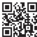
チャットボット(ふたば)