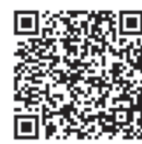
国税庁LINE公式アカウント