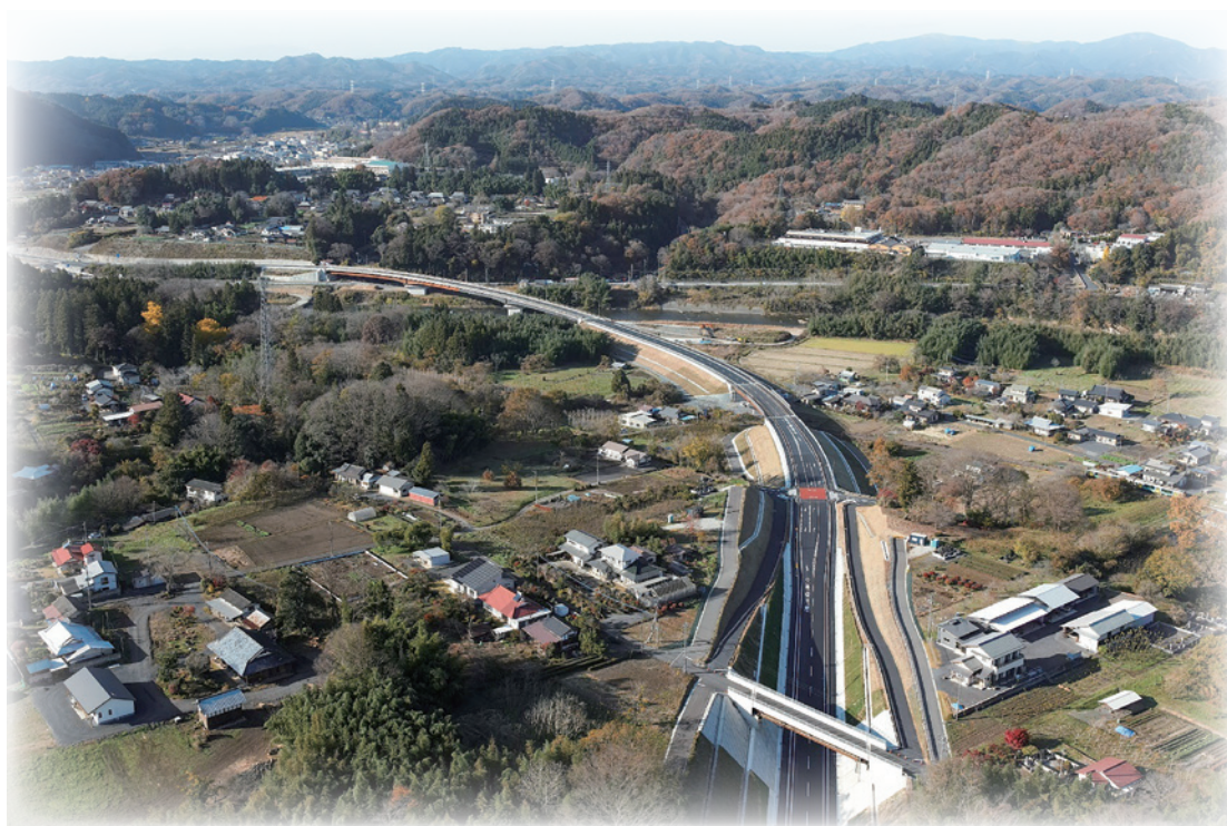
国道118号線バイパス

豊かな資源をつむぎ 人々が豊かに暮らし、訪れるまち 奥久慈に輝く日本一幸せなDAIGO