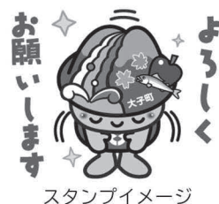
スタンプイメージ