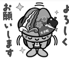
スタンプイメージ