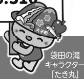
袋田の滝 キャラクター 「たき丸」