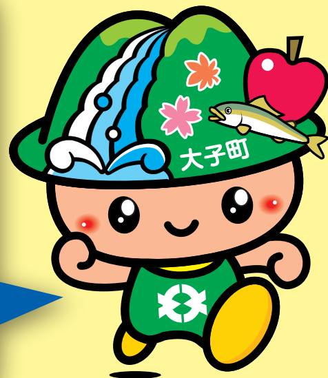
袋田の滝キャラクターたき丸