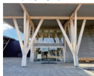
議会棟入口から入る