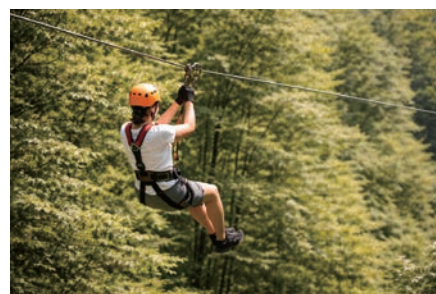
広域公園に整備予定のジップラインイメージ画像

町長 できるだけ多くの人に体験できるようにという方向性で進めて行きたい。詳細は決定次第報告したい。