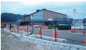
オープンが待たれる防災対応型観光交流施設