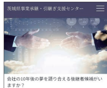
町の大切な産業を元気なうちに引き継ぐ流れを

飯村 中心市街地の展望は。 まちづくり課長 交流拠点施設BBDや研修センターを核とした環境づくりやまちなか創業希望者の受け皿を整備し、レトロなまちづくりに取り組んでいく。