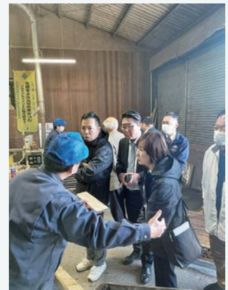
林業改良普及協会の研修視察で木材加工の現場を見学（各議員）