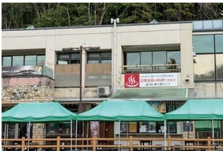
道の駅奥久慈だいごの休館日変更を期待

観光商工課長 小切手完全廃止とコスト大幅増の懸念のため電子決済式を選択し、前回同様8月頃の販売を見込んでいます。 根本 高齢化50%を超える町において、急なキャッシュレ