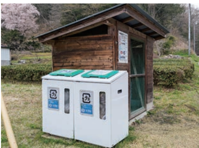
区の要望で設置された回収BOX（中郷）

生活環境課長 環境省も排出量の増加を見込んでいて、資源循環の取組み推進に向けて検討を進めている。町としては、国や県からの情報収集に努めていく。