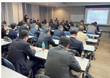
広報クニック「伝わる議会報づくり」の研修風景

今後も議会活動の見える化や町民の気になること等、記事の内容も充実させていけるよう広報委員一丸となって頑張っています。