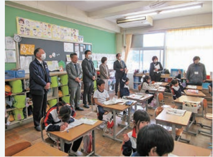
学校等を訪問し、教育状況の現状を確認（文教厚生委員）