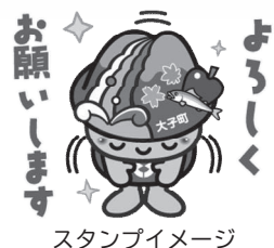
スタンプイメージ