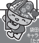
袋田の滝 キャラクター 「たぎ丸」